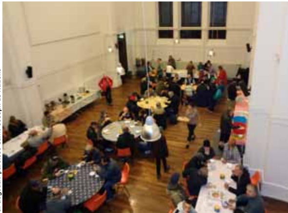
G. Gogoua / paroisse Saint-Joseph des Nations