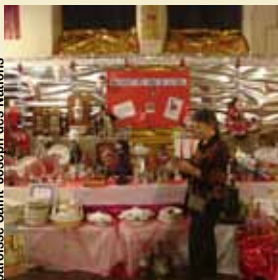
paroisse Saint-Joseph des Nations