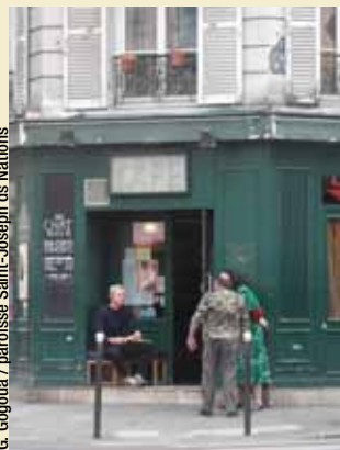
G. Gogoua / paroisse Saint-Joseph des Nations