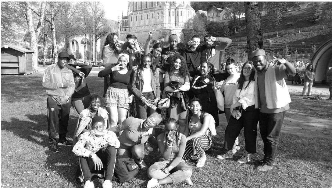
Le groupe à Lourdes, touché par la grâce ! Un grand merci aux parrains du Frat