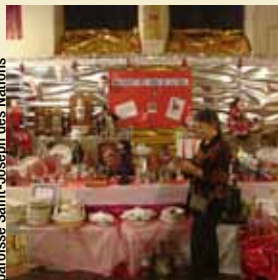
paroisse Saint-Joseph des Nations